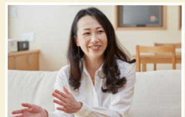
大阪府羽曳野市在住 Eさま

早朝にエラーに気づいて大阪ガスに連絡したとき、修理に来てくれるのは早くても1~2日はかかるかなと覚悟していました。でも、その日のお昼には必要な部品を持参して駆けつけてくれたんです。正直、対応の早さにはビックリ! 24時間365日連絡できるサポート体制は、不安な時間を最小限に抑えてくれるので、いつも通りの暮らしがすぐに戻ってくる安心感があると思います。